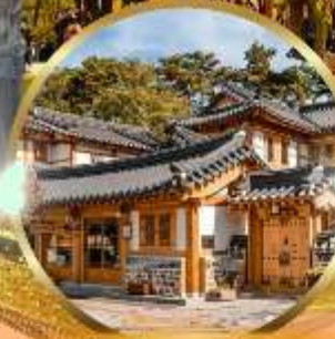
หมู่บ้านโบราณอินพยอง