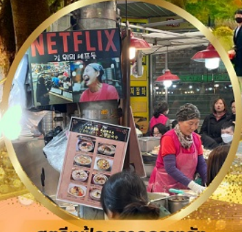
สตรีทฟู้ดตลาดกวางจง

สนุกสุดเหวี่ยงกับกิจกรรมขับริล LUGE !! พิเศษ !! นั่งกระเช้าชมวิว 360° เมืองคังฮวา