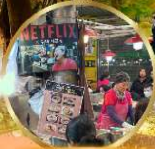
สตรีทฟู้ดตลาดกวางจ้ง