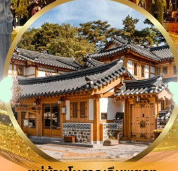
หมู่บ้านโบราณอินพยอง