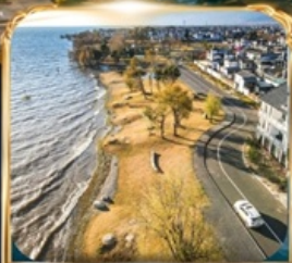
ทะเลสาบเอ่อไห่ โค้งตัว S