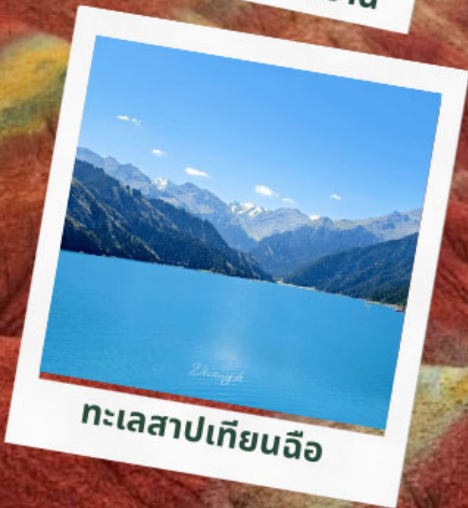
ทะเลสาปเทียนจื่อ