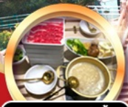
บุฟเฟ่ต์ชาบู เมียร์โมอัน!!