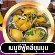
เม็ชู้ฟู้ดลี่ยุมบุน