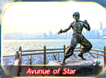
Avunue of Star