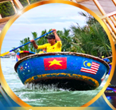
ล่องเรือกระดง