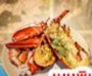
เมนูพิเศษ! “กุ้งล็อบสเตอร์”