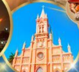
โบสถ์สิชมพู่