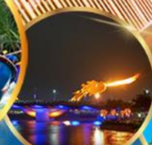
สะพานมังกร