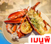
เมนูพิเศษ! "กุ้งล็อบสเตอร์"