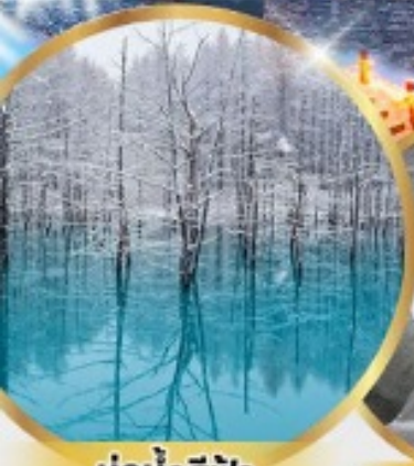
บ่อน้ำสีฟ้า