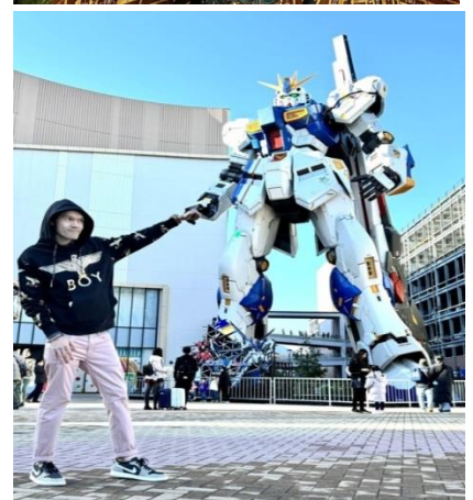
หุ่นกันดั้ม ชื่อ RX93 FF Nu Gundam

📍 รับประทานอาหารกลางวัน ณ ภัตตาคาร เดินทางต่อไปยัง ร้านค้า DUTY FREE ให้ท่านได้ช้อปปิ้งสินค้าปลอดภาษีที่มีคุณภาพ อาทิ เครื่องสำอาง โฟมล้างหน้า(แนะนำ) อาหารเสริม ขนม เครื่องใช้ต่างๆ ฯลฯ ...จากนั้นแวะ แซะรูปกับหุ่นกันดั้มยักษ์ ณ ห้าง LaLaport (หากมีเวลาพอ) มีขนาดใหญ่กว่า Unicorn Gundam ที่โตเกียวและใหญ่กว่า RX93 FF Gundam ที่ Gundam Factory Yokohama เรียกได้ว่าเป็นแลนด์มาร์คสำคัญของเมืองฟูกูโอกะในปัจจุบัน ...จากนั้นอิสระให้ท่านช้อปปิ้งย่าน เทนจิน (Tenjin) หรือ ย่านฮากาตะ (Hakata) เป็นย่านช้อปปิ้งขนาดใหญ่ใจกลางเมือง รวบรวมแหล่งบันเทิง อย่างครบครันไม่ว่าจะเป็นตึกต้นไม้ ร้านค้าที่น่าสนใจ และบรรยากาศสุดคลาสสิก หรือจะเป็นย่านของกินอร่อยๆ อย่างย่านยะไต (Yatai) หมายถึง ชุมชขายอาหารที่มีขนาดไม่ใหญ่มาก ที่รวมร้านอาหารแบบฉบับท้องถิ่นเอาไว้มากมาย