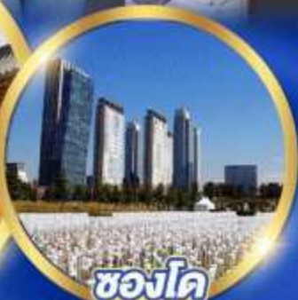
ชองโด Central park