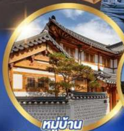
หมู่บ้าน วัฒนธรรมอินยอง