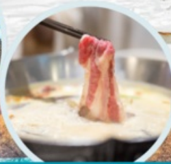
เมนูพิเศษ สุกินมาล่า