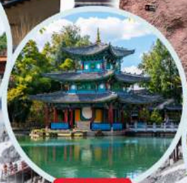
สระมังกรคำ