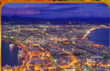
ชมวิวฮาโกดาเตะ