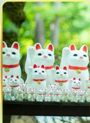
วัดโกโตคุจิ(วัดแมว)