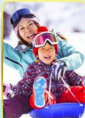
กิจกรรมลานสกีฟูจิ