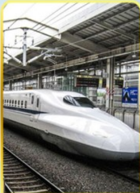
ทดลองนั่งชินคันเซ็น