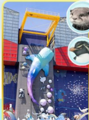
พิพิธภัณฑ์ไคยุคัง

🍷 ออนเซ็น 1 คั้น 🚽 นน.กระบะเป่า 1 ใบ 23 กก. ☀️ 7Days 5Night