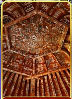
วัดซาชะเอโดะ