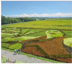
ดิสคัสนท่งนา