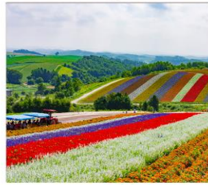
ท่งดอกไม้หลากสี