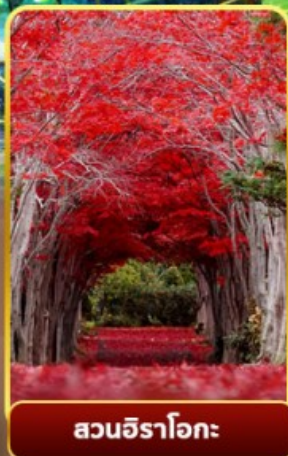
สวนอิระโอกะ