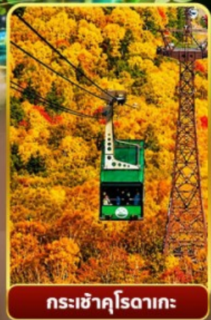
กระเช้าคุโรดากะ