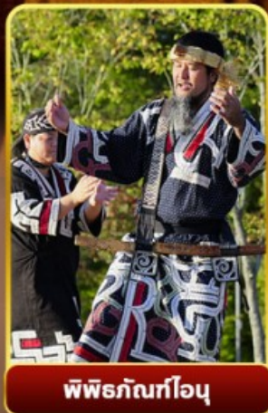
พิธีภักดิ์โอบุ