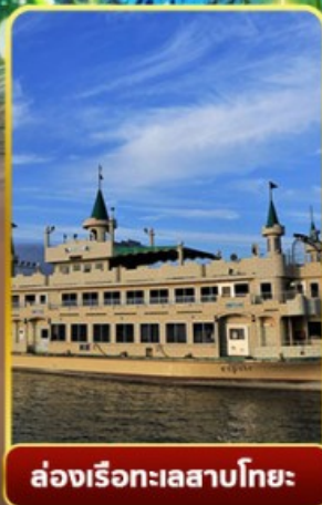
ล่องเรือทะเลสาบโทยะ