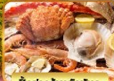
ปิ้งย่างร้านดังเน้นตะ