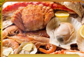
ปิ้งย่างร้านดังมันดะ