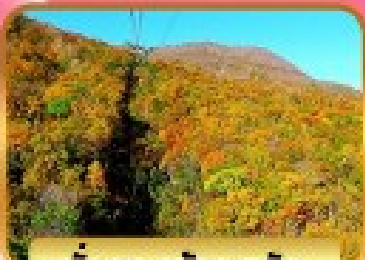
นั่งกระเช้าจุสุซัง