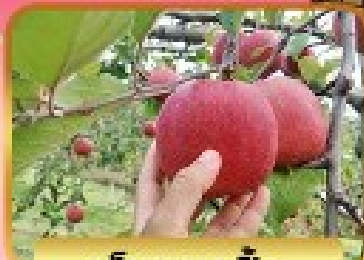
เก็บแอมเปิ้ล