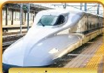
สัมผัสนั่งชินกันเซน