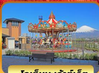
โกเกมบะเจ้าท์เล็ด