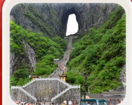
“กำประตูลิ่วหวง”