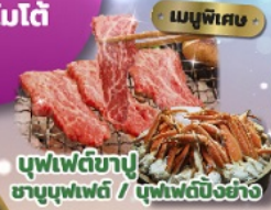
บุฟเฟ่ต์ข้าว ทานบุฟเฟ่ต์ / บุฟเฟ่ต์บิงช้าว