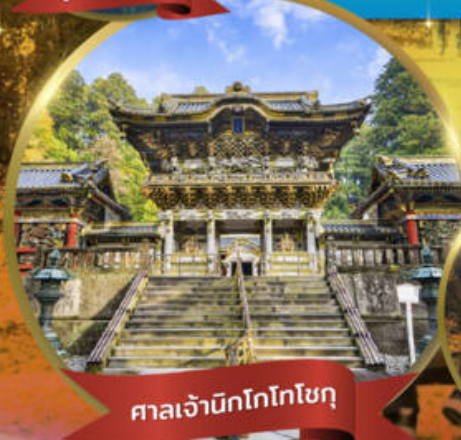
ศาลเจ้ามิกโกโทโชกุ