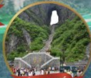
กำแพงมรกต