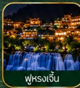
ฟูหรงเจิ้น