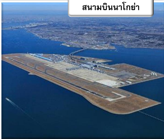
สนามบินนาโกย่า

เวลา 00.05 น. ออกเดินทางสู่ สนามบินนาโกย่า ประเทศญี่ปุ่น โดย สายการบินไทย เที่ยวบินที่ TG 644