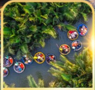
น้ำร้อนกระดัง