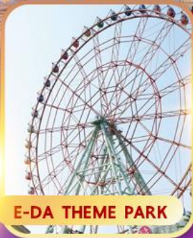
E-DA THEME PARK