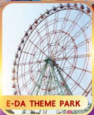
E-DA THEME PARK