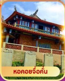
หอคอยจ้อคั่น