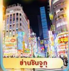
ย่านชินจูกุ