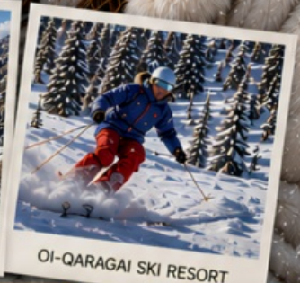
OI-QARAGAI SKI RESORT