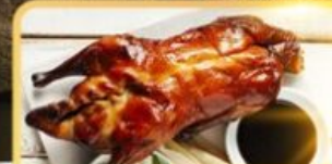
เปิด Four Season