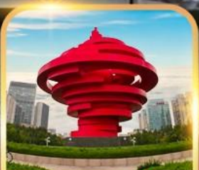
จตุรัสห้าสี