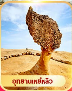
อุทยานเหย์หลิว