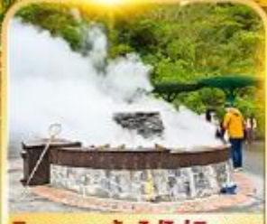
กิจกรรมต้มไข่ไถ่ผิงซาน