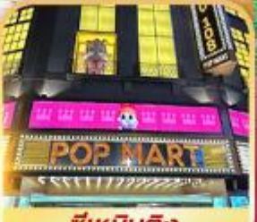
ซีเหมินติง