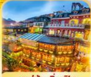
หมู่บ้านจิวเฟิน