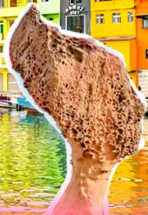
อุทยานเหย์หลิว