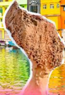
อุทยานเหย์หลิว