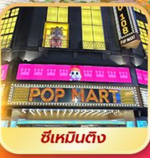
ซีเหมินต๋ง