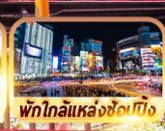
พัทไถลี้แหล่งช้อปปิ้ง