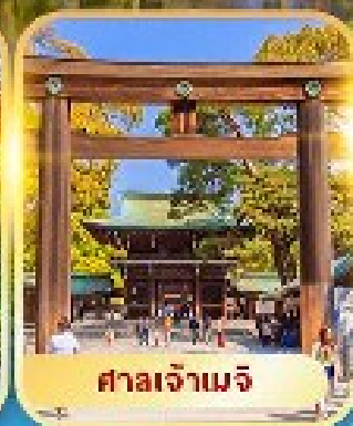
ศาลเจ้าเมจิ