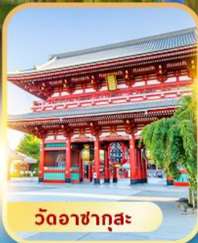
วัดอาซากุสะ