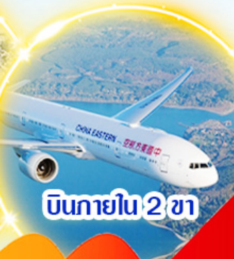
บินภายใน 2 ชม