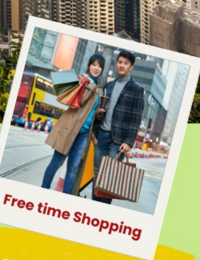
Free time Shopping