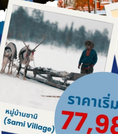
หมู่บ้านซามิ (Sami Village)