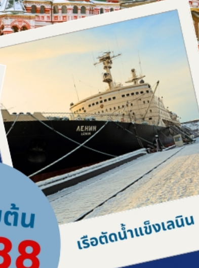
เรือตัดน้ำแข็งเลนิน