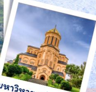
มหาวิหารแห่งทบิลีซี