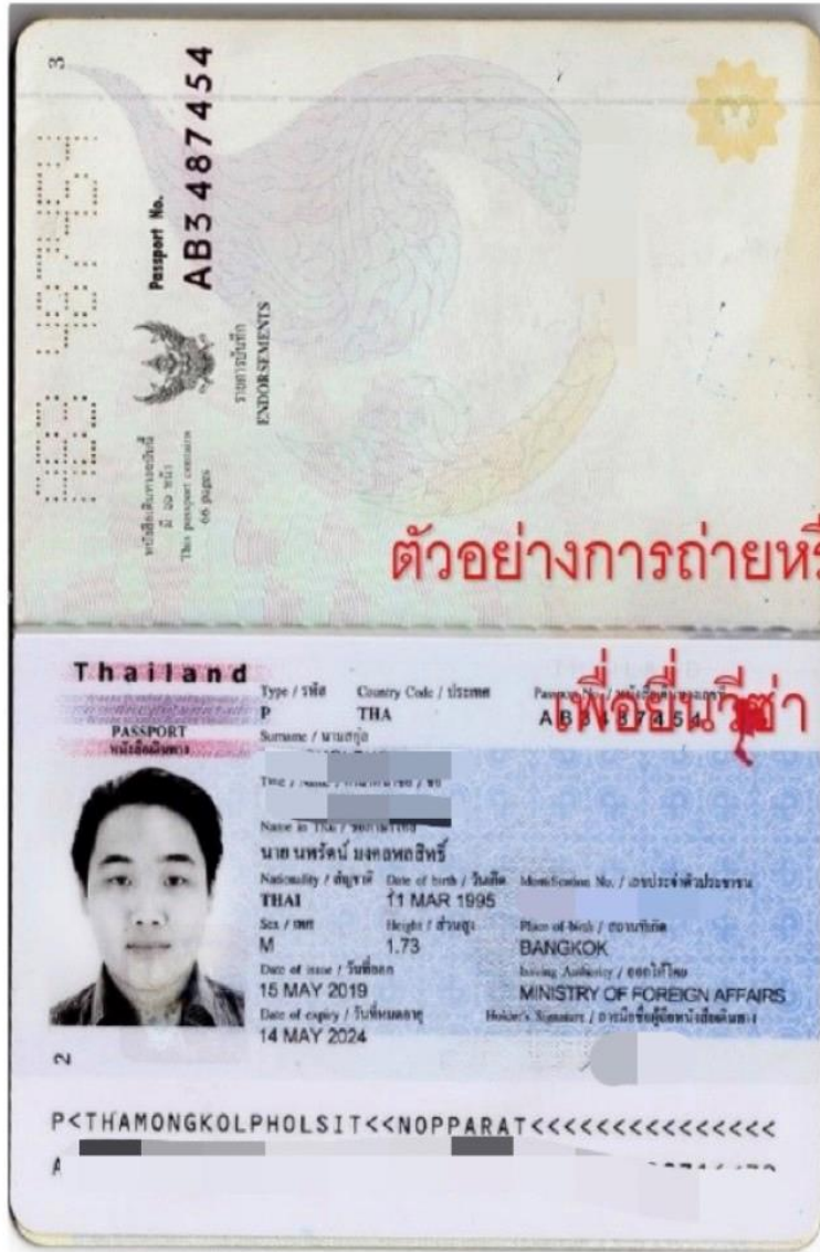
ตัวอย่างการถ่ายภาพหรือสแกนหน้าพาสและรูป