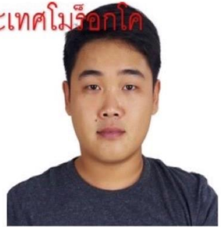
เพื่อเป็นวีซ่า ประเทศเม็กซิโก