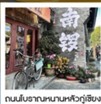
ถนนโบราณหนานหลิวกู่เซียง