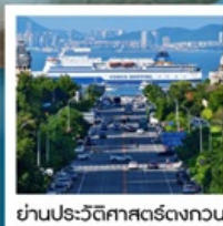
ย่านประวัติศาสตร์ตงกวน

Fisherman's Wharf • จัตุรัสชิงไห่ (รวมรถราง) • ถนนตงกวน • เวนิสแห่งต้าเหลียน • ถนนรัสเซีย