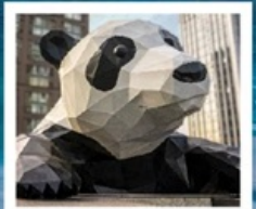
ห้าง IFS แพนด้าป็นตึก

จัดทริปหย่างเกี้ยนวู / รูปปั้นหมีแพนด้าเซลฟี่ / เมืองโบราณกัวนเซี่ยน คำธารสีฟ้า / อุทยานภูเขาสี่ดรุณี / อุทยานชวงเฉียวโกว (รวมรถอุทยาน) อุทยานปีงเิ่งโกว (รวมรถอุทยาน + รถแบตเตอรี่) / อุทยานจิวจ้ายโกว (รวมรถเหมา) ถนนคนเดินซุนชู่ / ห้าง IFS แพนด้าป็นตึก / ถนนคนเดินไท่กู่หลี่ ถนนคนเดินชอยกว้างแคว (POP MART)