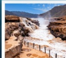
น้ำตกหูชิว