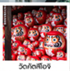
วัดคังสึโอจิ