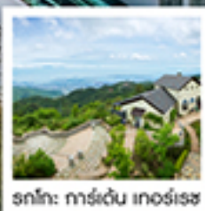
รถไฟ: คาร์เด็น inosise