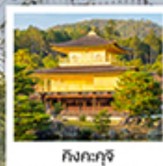
กิงคะกุจิ