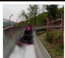
สไลเดอร์จากท่าแพงเมืองจีน