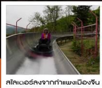
สไลด์ล่องจากกำแพงเมืองจีน