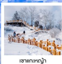
เขากระหลว้า