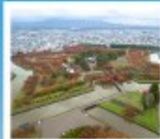
โทริยวาระกุ ทาวเวอร์

หุบเขานรกจิโระคุดาบิ / โทดองฮังของคานามิชิ ตลาดเช้าเมืองฮาโกดาเตะ / โทริยวาระกุ ทาวเวอร์ ภูเขาไฟอุสุ / จุดชมวิวยุซึกิ / ค่องเรือชมทะเลสาบโทบะ สวนอุซุมิโนะ / สวนพฤกษศาสตร์ / เก็บผลไม้ / สัมผัสน้ำพุร้อน พิพิธภัณฑ์คองดงดริ / ภาวนาโอบาโนราชน / โรงเป่าแก้วคิตาฮิชิ เนินพระพุทธรเจ้า / ถนนฮิโอบังทาบูกิจิ / ย่านฮูซุกิโนะ