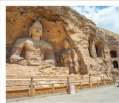
หยุนกิงสี่ถุ