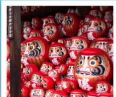
วัดคิตสึโอจิ